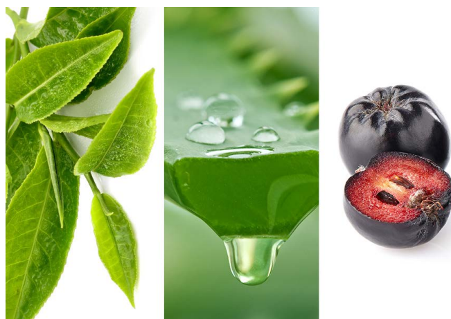
Voll das Leben genießen mit der richtigen Mischung an Pflanzenpower.

Der unfermentierte grüne Tee ist bekanntermaßen reich an Vitaminen, Mineralstoffen und Spurenelementen. Im Gegensatz zum Schwarzen Tee bleiben im Grüntee der natürliche Blattfarbstoff und seine Flavonoide bestens erhalten. Auf Grund seines hohen Gehaltes an Polyphenolen hat er starke antioxidative Eigenschaften und wirkt unter anderem entzündungshemmend. Die berühmten Hundertjährigen auf der japanischen Insel Okinawa sind ein hervorragendes Beispiel für die gesundheitlichen Langzeitwirkungen dieses lebensspendenden Getränks.