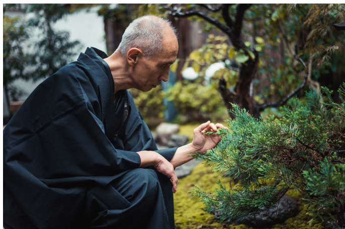
Grüner Tee war ein fixer Bestandteil der traditionellen japanischen Ernährung und trägt zu Gesundheit und Langlebigkeit bei.